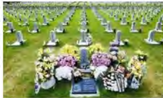
ベトナムで戦死した韓国兵が眠る国立ソウル顕忠院第2墓地

ベトナム戦争では、韓国の若者たちが派兵され、5千人以上が戦死し、それよりはるかに多いベトナム人を殺しました。しかし、日本の自衛隊員はベトナムに派兵されませんでした。戦争しないと決めた憲法9条があったために派兵できなかったのです。