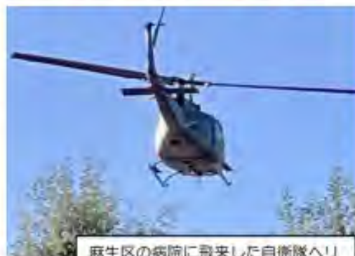
麻生区の病院に飛来した自衛隊ヘリ

沖縄や南西諸島、そして日本各地でも対中国を想定した米軍と自衛隊の軍事演習が行われています。