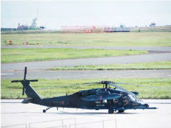
北九州着陸後の救難ヘリ UH-60J。場所はいちばん南側(苅田側)の駐機場。後ろに滑走路延長工事の様子が映っている。

長い日時を経て完成され、今では年間1,175,000人もの旅客が利用し、様々な人々が働き、近くに養殖牡蠣の筏が浮かぶ北九州空港。貨物航空機も1日に10数便離発着している。発展を続けるこの北九州空港が、今回の「キーン・ソード25」で自衛隊機に利用される第一歩となった。いずれ米軍機もやって来ることだろう。いかなる理由があろうとも、この空港が他国から攻撃を受けるようなことがあってはならない。この空港から飛び立った軍用機による他国への攻撃があってはならない。