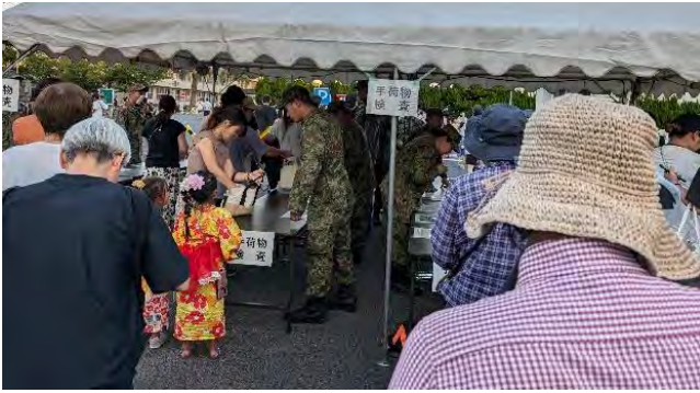
上…まつり会場の入り口で手荷物検査をする自衛隊員。 下…会場内の戦車の前で、写真を撮る家族連れ。