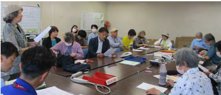
区役所まつりみなみ事務局のコミュニティ支援課に、場所変更の経緯や理由をただし、小倉駐屯地での開催を中止するよう求める、各団体のみなさん

コミュニティ支援課は、志井公園での開催は、①まつり終了後、企救丘駅に人が集中するため危険である、②打ち上げ花火の火の粉が周辺の木に燃え移る危険が指摘されている、という理由から場所の変更を決め、いくつかの場所をあたった結果、自衛隊小倉駐屯地の使用が可能となったと説明。自衛隊での開催の場合、テント設営や警備等を自衛隊員が行うため経費節減になることが③番目の理由でした。