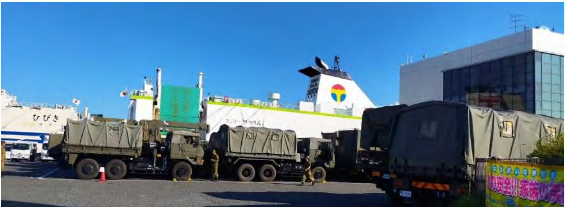
上下とも、乗船を待つ自衛隊の車両

特定利用空港の問題だけではない。北九州市は交通の要衝で、港湾都市でもある。今回の「キーン・ソード」でも全国から自衛隊の隊員・車両が九州に集結した。新門司のフェリーターミナルはその出入り口であった。新門司には阪九フェリー・名門大洋フェリー・オーシャン東九フェリー・東京九州フェリーの4社が発着する。「キーン・ソード」終了後の11月初旬。自衛隊の車両が連日フェリーターミナルに集結した。どの社のフェリーを利用したのかはわからないが、大量の軍用車両を輸送することで民間の物資輸送に支障はなかったのだろうか。今後はフェリーにも注目していきたい。