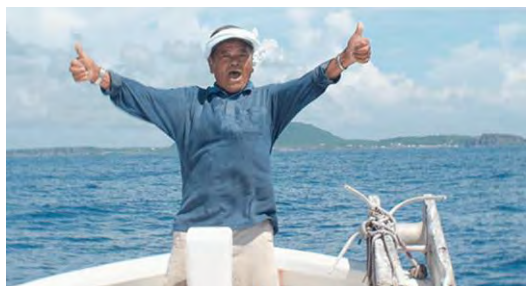
映画のワンシーン