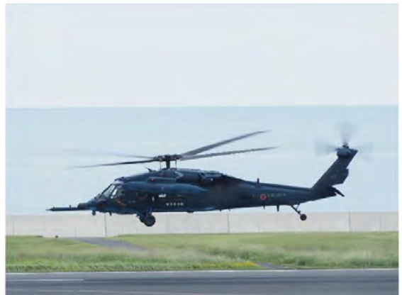
離陸の際、滑走路でしばらくホバリング。機体番号 384614 と書かれていた。