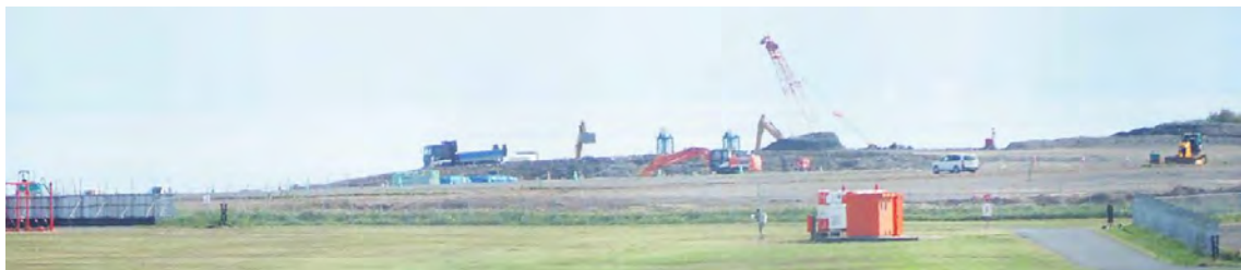
北九州空港の滑走路の延長工事の様子。2500mを3000mに延ばす工事は、昨年12月2日着工。供用開始は2027年8月31日の予定