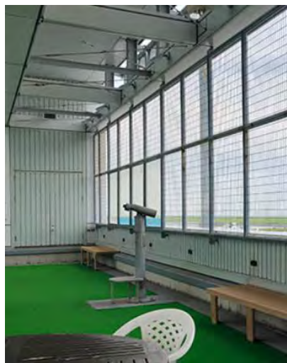
鳥かごの中にあるような気分になる、北九州空港の展望デッキ

私が北九州空港の展望台にいたのは、10時～11時過ぎまでです。現地にはやはり行ってみるものです。私は初めてヘリコプターの「タッチ&ゴー」を見ました。私がいる間5回くらい繰り返したでしょうか。いつも小倉北区の我が家の上空を飛んでいる、耳に