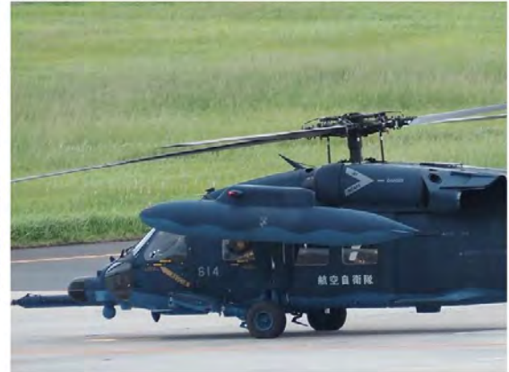
UH-60J の機体前方部。突き出た棒状のものは空中給油の受油装置。機体側面上部のタンク状のものは予備燃料タンク。