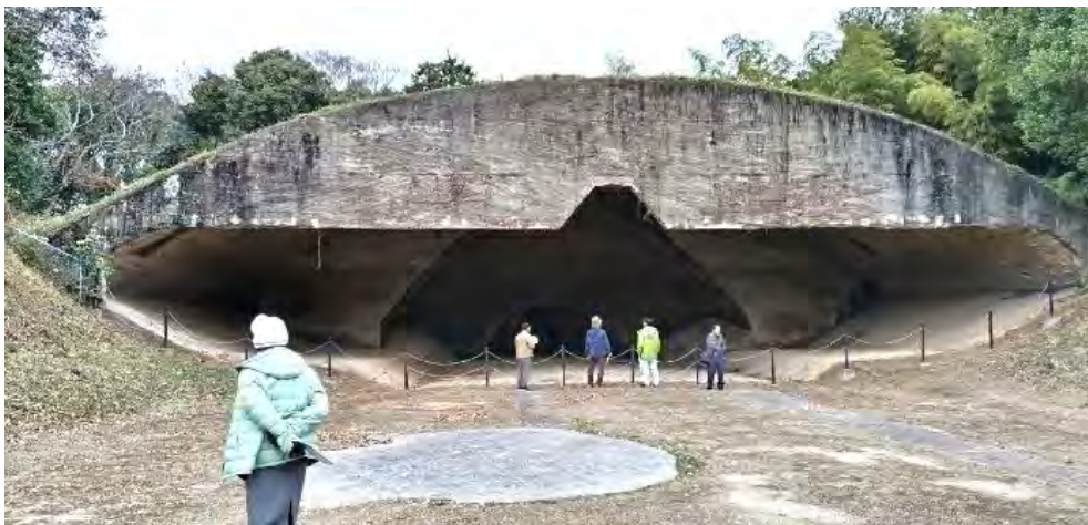
海軍築城航空基地稲童掩体。想像以上の大きさに参加者は驚いていた。

朝鮮戦争後に米軍は築城基地を去った。しかし今、再び米軍が築城基地にやって来た。しかも今度は米軍機だけではなく、我が国の自衛隊空軍機が一緒になって訓練し、他国の人々に空から襲い掛かろうとしている。タッチ&ゴーを繰り返すF35とF2を眺めながら、私はそのことを最も恐れた。（おおのやすのり）