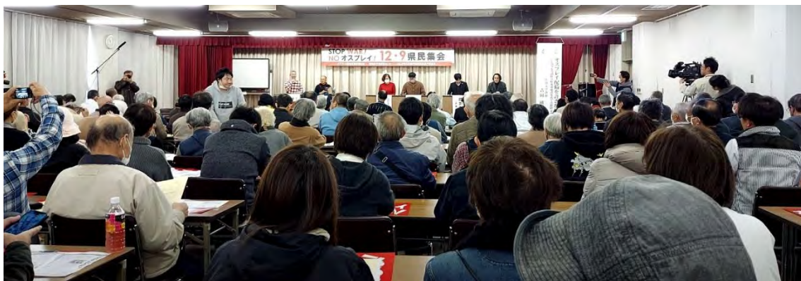
昨年12月9日に行われた、佐賀空港へのオスプレイ配備反対集会の様子