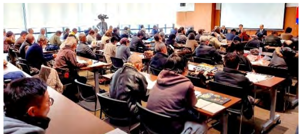
昨年 12 月 20 日の裁判支援集会的様子

最後の意見交換の中では、「裁判は長引くだろうが、その間も工事が進めば、市民の間に『実際にたくさんお金をかけて工事してきたのだから、今さら止めても無駄になる』というあきらめの気持ちが出てくる。非暴力の実力行使をして工事を遅らせる行動を『市民の会』とは別組織で並行して進めることも必要」という意見も出た。そうかもしれない。これからも佐賀からは目を離せない。(むねよしまこと)