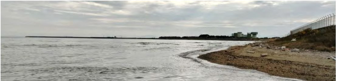
すでに海に突き出ている築城基地の滑走路だが、これが300m延長される予定

行橋京都教育会館から基地周辺へ。まずは周防灘に延長される滑走路と完成した米軍弾薬庫を見学した後、防衛省が整備したという松原展望台へ。駐車場には多くの車。その公園から遠くに基地が眺められ、多くの人々が双眼鏡やカメラを手に熱心に基地を見つめている姿に驚く。次々と戦闘機がお尻から真っ赤な炎を噴き出して飛び立ち、反対側から着陸と離陸を繰り返している。これがタッチ&ゴーか。離陸時、着陸時の爆音がバリバリバリとけたたましくいつまでも鳴り響く。これが日米共同訓練か。