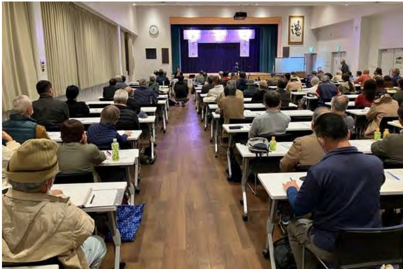
2023年12月26日に行われた、オール沖縄会議の学習会。