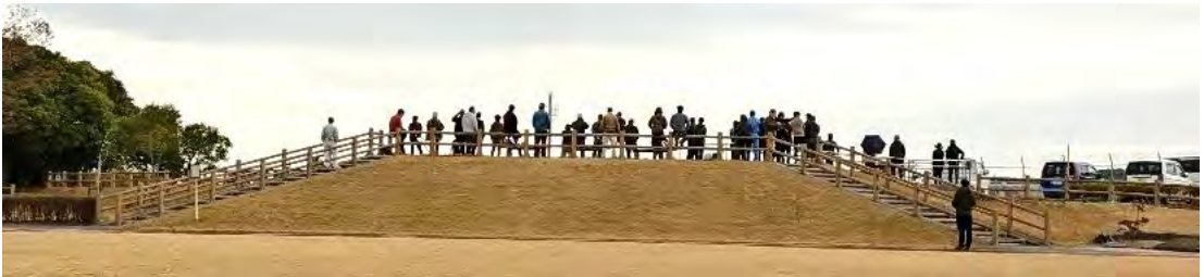
築城基地のすぐそばにある松原展望台には、日米共同訓練中という事もあって、たくさん見物人が