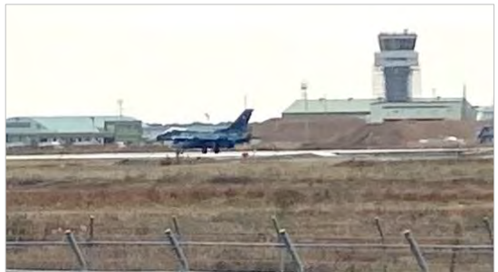
体が揺れるような爆音とともに飛び立つ戦闘機

米軍再編に係る嘉手納飛行場から築城基地への訓練移転(日米共同訓練)が12月5日～15日の日程で行われていた。防衛省の「お知らせ」によると、使用空域：山口北方沖空域及び九州西方空域、訓練内容：戦闘機戦闘訓練等、参加部隊：《米軍》第18航空団(嘉手納)《航空自衛隊》第8航空団(築城)、参加規模：米軍機F-35Aが12機程度、航空自衛隊F-2が8機程度、人員200名とある。F-35Aは高いステルス性能を備え、25mm機関砲、空対空レーダーミサイル、空対空赤外線ミサイルを武装しており、三沢基地に配備されている主力戦闘機(航空自衛隊ホームページから)。