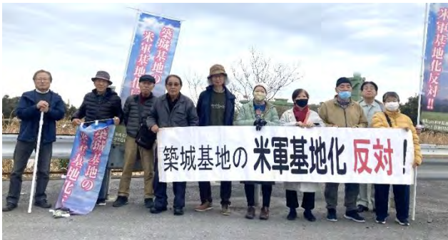
皆で記念写真を撮りました

交差点から基地正門まで徒歩移動し、基地内をまぢかに見学。自衛隊員のほとんどは基地外で生活をしており、近くの小学校は子供が増加しているという。今回の共同訓練参加の米軍人60名は基地外に宿泊しているというが、ホテル名は公表しない。