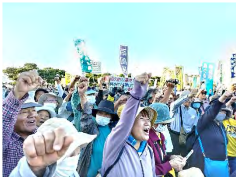
上下…最後はみんなで「がんばろー」を三唱