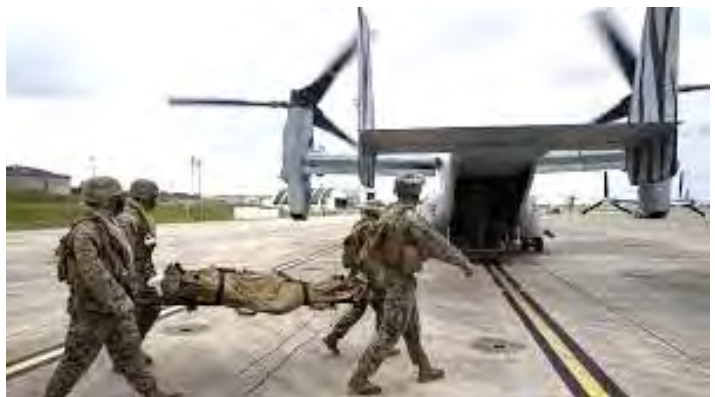
11月に九州・沖縄で実施された日米共同演習で、負傷者をオスプレイに運ぶ訓練中の自衛隊員

最高裁が辺野古に基地をつくることを認めたからといって、沖縄県民をはじめ国民はそれに縛られるものではありません。最高裁判決は、沖縄県知事が辺野古埋め立てを認めないのはけしからんと、防衛省が国土交通相に訴えたのを違法でないとしたものです。辺野古基地のための埋め立てを認めない沖縄県知事の主張をよく検討して、知事の決定は法律違反だという判断まではしていません。