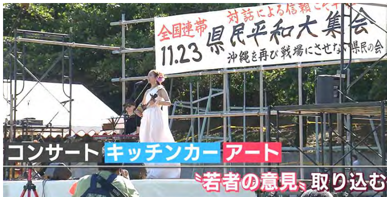
集会の前には 2 時間のコンサートがあり、沖縄の歌やエイサーの踊りも楽しむことができました。