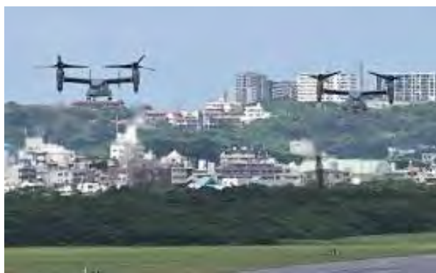
沖縄市の民家上空を飛ぶオスプレイ CV22

政府は、最高裁判決をうけて「代執行」などと言い出しました。大手マスコミも「沖縄県が最高裁に従わずに拒否し続けているのは問題だ」(読売新聞 11 月 17 日)などと、政府の後押しをしています。