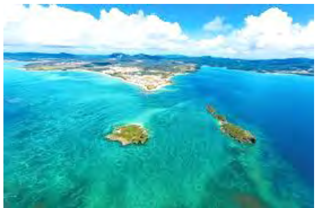
美しい辺野古・大浦湾に軍事基地はいらない