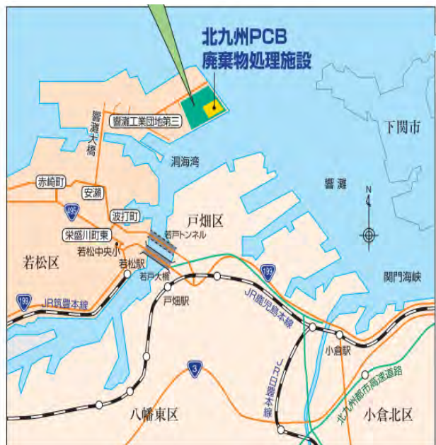
北九州の PCB 処理工場はエコタウンの中にある

また、PCB を積んだトラックが北九州市内を走る時は、先導車が付き、処理工場では、トラックが今どこを走っているか、GPS で確認を