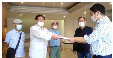
2021 年、請願を市議会事務局に提出する世話人