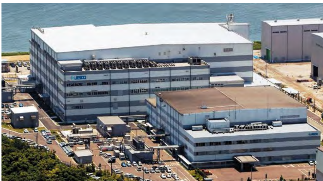
PCB 処理施設の全景(パンフレットから)。手前の第 1 期処理場は、解体工事に向け操業は行われていない。後ろの第 2 期処理場の新規受け付けは 12 月 28 日までで、来年 3 月末には操業を終える予定。

北九州の処理工場は日本で最初につくられた工場で、2004 年 12 月に操業を開始。計画では、2015 年 3 月に処理を終了し、2016 年 7 月には施設を解体する予定でしたが、住民の反対を押し切り、2 度も延長され、やっと 2024 年 3 月に操業が終わる段取りです。それに向け、第 1 期処理場は、すでに解体に向けた作業が始まっており、現在稼働している第 2 期処理場も、処理の新規受け付けは今年で終わります。