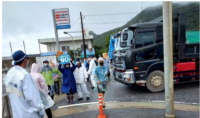
安和栈橋の抗議行動の様子

6月6日から8日までの3日間は、「安和栈橋、塩川港大行動」が取り組まれ延べ330人が参加しました。1日当たりダンプカー約600台（運搬船4隻分以上）の搬出を減らすことができたということです。