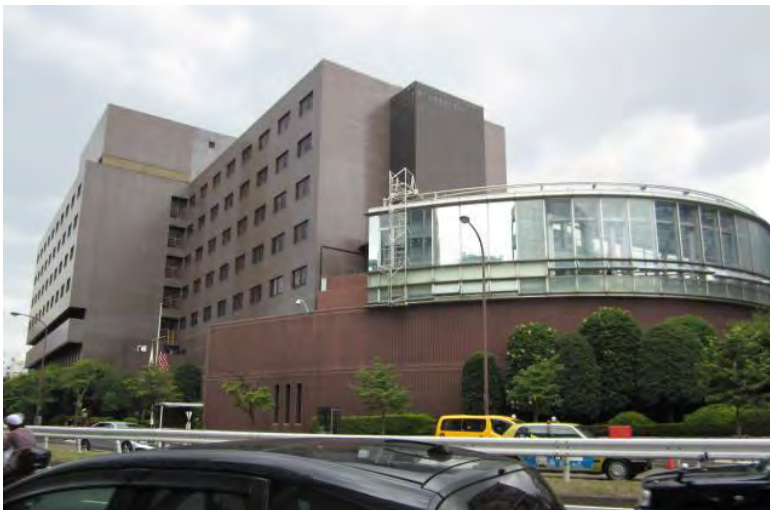
南麻布にある「ニュー山王ホテル」

立場が違うはずの文官と軍人の組み合わせになっているため、アメリカ側は常に軍事的観点から協議に臨み、軍事的必要性に基づく要求を出してきます。米軍基地の運営や訓練をはじめ、あらゆる軍事的活動を円滑に行うことを最優先にしています。