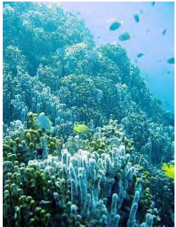
(サンウェーブカヤックス)