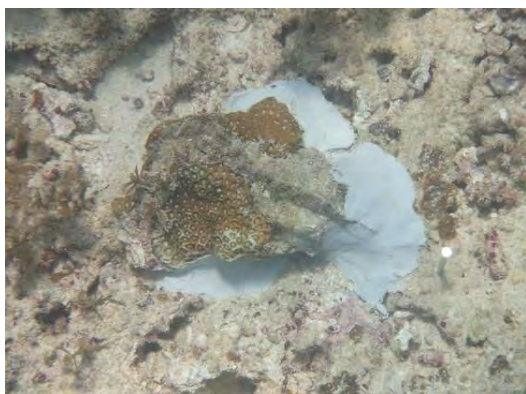
左…水中接着剤で海底に接着されたサンゴ。 右下…サンゴの移植を行う作業員と抗議の人。 左下…サンゴの移植計画図

現在は、I地区の830群体のサンゴ類だが、続いてJPK地区の38,760群体ものサンゴ類が移植される。最終的には75,000群体ものサンゴ類が移植されるので、水中接着剤の影響は無視できない。防衛局は、この接着剤の安全性について説明しなければならない。