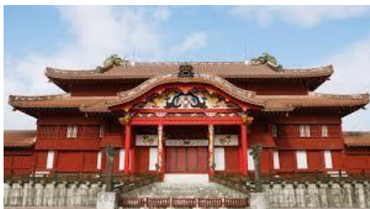
在りし日の首里城正殿