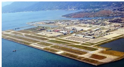
極東一の規模となった岩国基地

米軍は今年9月、この事故の報告書をまとめ日本政府に報告していた。しかしその報告書にはありきたりの内容で、特に新