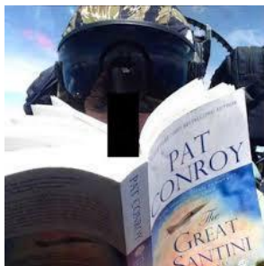
操縦中に本を読むパイロット

しかしこの報告書をくわしく読み込んだ共同通信の記者が、日本中を驚かさ驚愕の事実を報道した。書かれていたのは、岩国基地の戦闘機部隊の隊員が、操縦中に手放して本を読んだり、ひげを剃りながら自撮り行為、墜落事故の乗員二人からは睡眠導入剤の成分までも検出された。薬物の乱用やアルコールの過剰摂取、不倫なども有り軍隊の規律が大きく乱れていた。